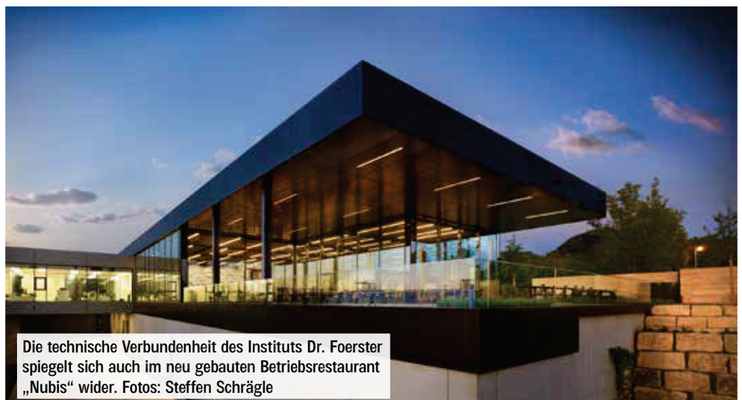
Die technische Verbundenheit des Instituts Dr. Foerster spiegelt sich auch im neu gebauten Betriebsrestaurant „Nubis“ wider.

an metallischen Halbzeugen entwickelt und vertreibt. „Wir wurden bereits 2011 mit der Um- und Neugestaltung des Unternehmens beauftragt. Mit den Jahren sind die nunmehr zehn einzelnen Neubauten zu einem zusammenhängenden Komplex verschmolzen“, erklärt Frey. Erreichbar ist das Betriebsrestaurant vom Bestandsgebäude aus über eine gläserne Brücke, die einen Bruch zu allen anderen Gebäuden schafft. „Lediglich die Grundkonstruktion, also die pavillonartige Stahlhalle, gleicht dem Design der anderen Häuser“, beschreibt Frey das Konzept. „Das Restaurant selbst soll bewusst eine Abgrenzung zum Stahl schaffen, um das sich bei den Mitarbeitern von Dr. Foerster das